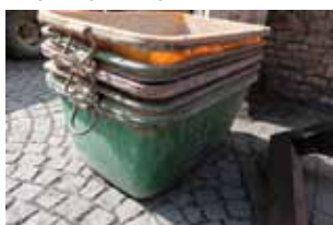
die von Abfallgemischen. Prüfen Sie auch im Vorfeld der Arbeiten, inwiefern die bauausführenden Firmen ihre Abfälle selber entsorgen. So können Sie Handwerker verpflichten, ihre Verpackungen wieder mitzunehmen. Insbesondere bei einem Gebäudeabbruch sollten Sie verschiedene Abfälle von Anfang an trennen. Evtl. müssen Sie bestimmte Vorgaben für die Abbrucharbeiten machen, um die verschiedenen Materialien getrennt zu halten.

UNTER BAUSTELLENABFÄLLEN versteht man ein Gemisch aus Verpackungen, Wertstoffen, Problemstoffen und Restabfällen. Es lohnt sich, bereits bei der Planung einer Baumaßnahme die Abfallentsorgung zu berücksichtigen, da die Entsorgung von sortenreinen Abfällen in der Regel günstiger kommt als