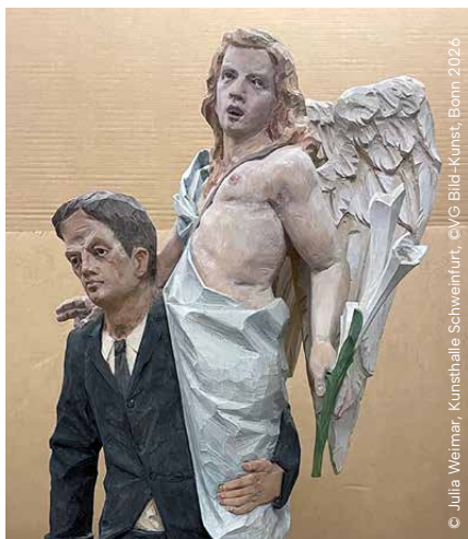
© Julia Weimar, Kunsthalle Schweinfurt, cyG Bild-Kunst, Bonn 2026

Kontakt: Tourist Information Gerolzhofen, info@gerolzhofen.info 09382-903512