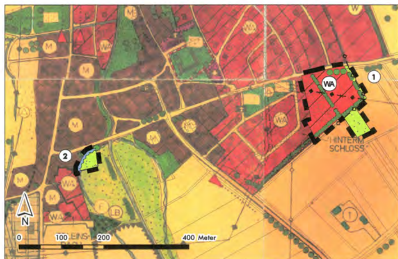
8. Änderung des Flächennutzungsplans