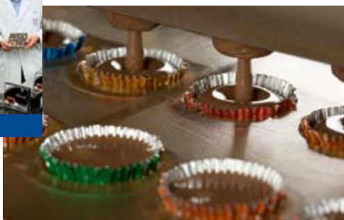
Eichetti Confect Spezialitäten, Werneck

„Wir haben hohe Ansprüche an eine reibungslose Logistik beim weltweiten Vertrieb unserer Confect-Spezialitäten. Dabei zählt nicht nur unsere zentrale Lage in Deutschland. Aufgrund der Qualität der Logistiker in unserem Umfeld können wir weitestgehend auf eigene Lieferfahrzeuge verzichten.“