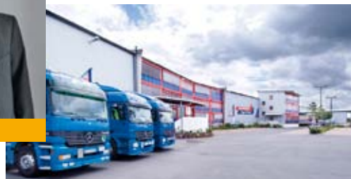
Schäflein AG... denn wir machen Logistik, Rötthlein

„Es gibt hier viele Industriebetriebe, die sich nach und nach auf ihre Kernkompetenzen konzentrieren und die Logistik auslagern. Als Logistikdienstleister konnten wir uns im Landkreis Schweinfurt so hervorragend entwickeln, weil Lage und Flächenangebot so gut sind. Außerdem ist unser Personal sehr verlässlich und – im Vergleich mit anderen Standorten – noch bezahlbar.“